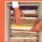
تحليل وثائق والمستندات